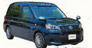
ジャパntaxi ※展示のみ(〜8/31まで)