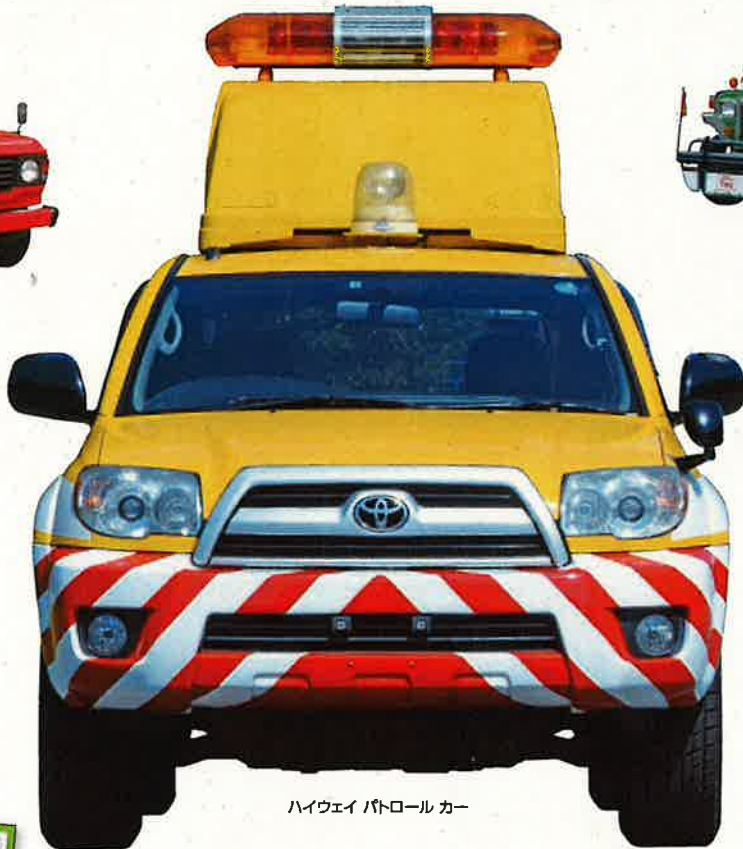
ハイウェイ パトロールカー