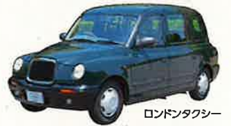
ロンドンタクシー