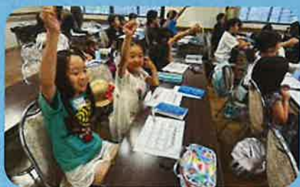
①レッスンスタート!