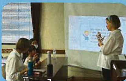
②アクティビティー