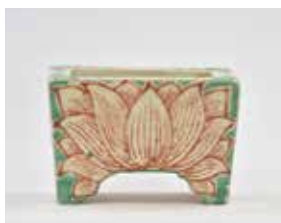
《香炉》個人蔵、江戸時代後期