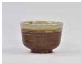
《腰鑄》空兵衛窯跡出土、江戸時代中期