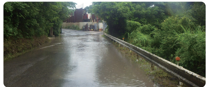
山路海上線冠水の様子

A 6月2日の大雨によって各地で被害が生じ、復旧対策を行うもので、上品野三国山線の法面对策、大六川沿いの台六1号線の法面对策、曾野町の路肩対策及び山路海上線の冠水対策の4か所の事業を予定している。