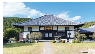
東向寺(天草市の民吉ゆかりの寺)

A 天草市における本市の学芸員による講演会2回、天草市の学芸員を招いての民吉フォーラム、民吉の足跡を辿る研修、子ども陶芸展での天草市の紹介、民吉の真実展への天草市からの出展等で交流回数が増えたもの。