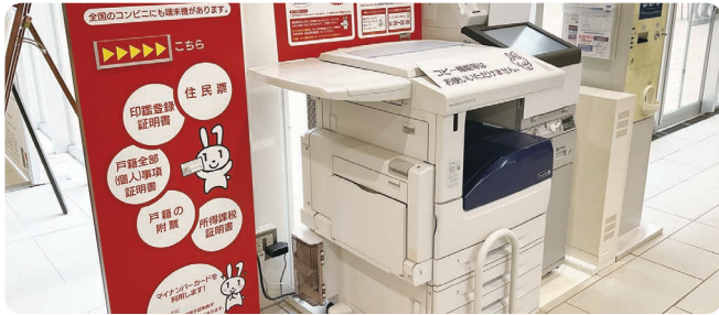
市役所内の多機能端末機

A 現在はコンビニ交付の際、多機能端末機にマイナンバーカードを設置して暗証番号を入力する形だが、カードの機能をスマートフォンに持たせることで、スマートフォンがあればカード無しでも証明書の交付が受けられるようになる。(年内実施予定)