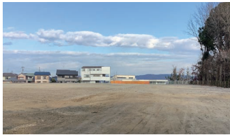
現在の旧祖母懐小学校跡地

A 令和4年度は宅地分譲の入札を行ったが、応札がなく現在売却方法を検討している。事業者ヒアリングやアンケートでは宅地需要はあることは判明しており、早期売却を目指している。