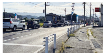
上水野町交差点付近の様子

A 令和4年度の現況調査をもとに今年度交通解析を行う。対策案を取りまとめ、その対策案をもとに、県道の管理者である愛知県を含め関係する管理者と協議を実施する。