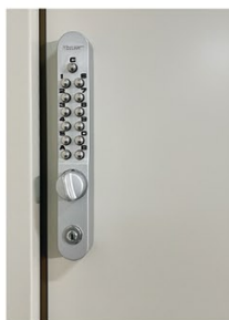
オートロック (女性用仮眠室)