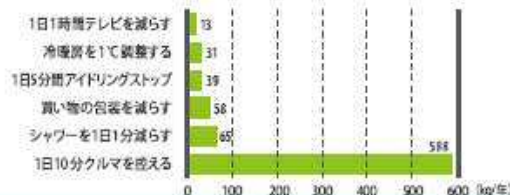
■1世帯1年あたりのCO 2 削減量

家庭から排出されるCO 2 の約4分の1がクルマによるものですが、例えば、1日10分クルマの利用を控えると、年間で約588kgのCO 2 が削減できます。これは冷暖房を1度調整した場合のCO 2 削減量の約20倍にもなります。