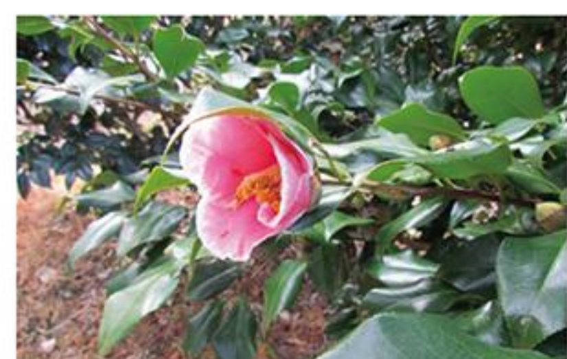
椿の花は4月中旬まで見頃です