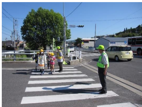
登下校中の子どもたちの様子