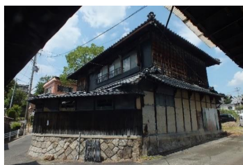
旧山繁商店の外観