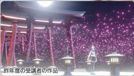
昨年度の受講者の作品