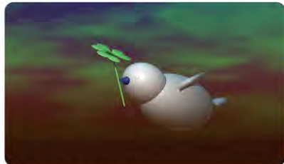
昨年度受講生の作品