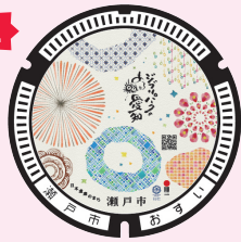
↑ 瀬戸焼やまちの風景