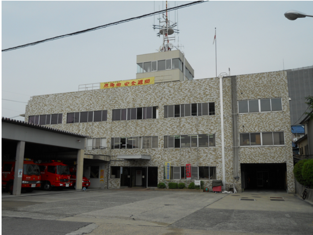
消防本部・消防署庁舎