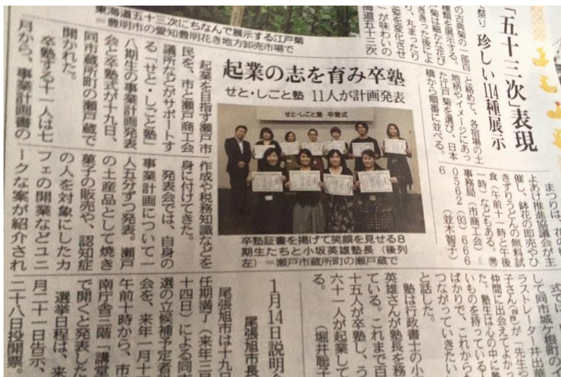
卒業式の新聞掲載記事 (2015. 11. 20 中日新聞)