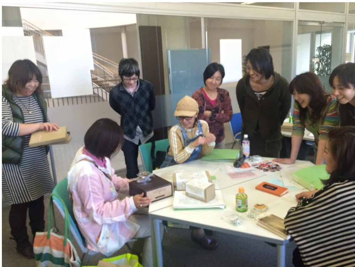
(8期生の新商品開発会議風景)