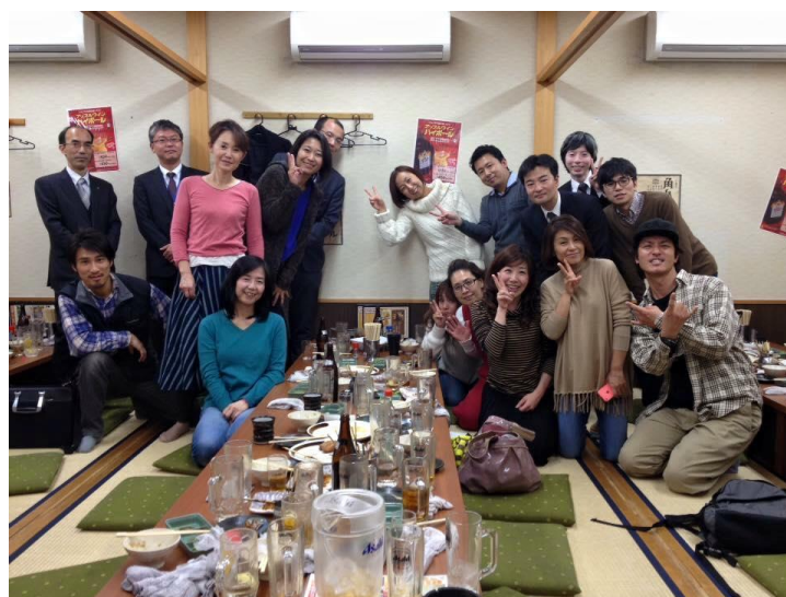
(2015. 11. 19 卒塾後の懇親会風景)