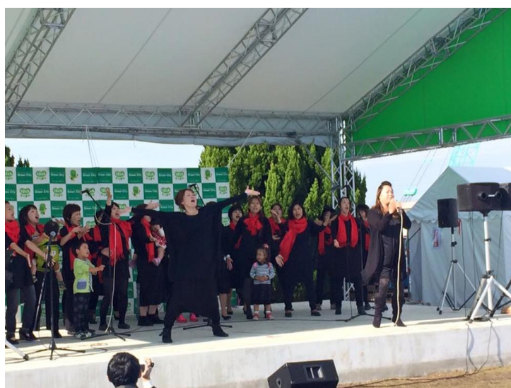
(2015. 11. 21 わく WORK パークの様子)

第8期も、わくWORKパークをはじめ、塾生企画や塾生の参加するイベントが瀬戸で数多く開催されました。