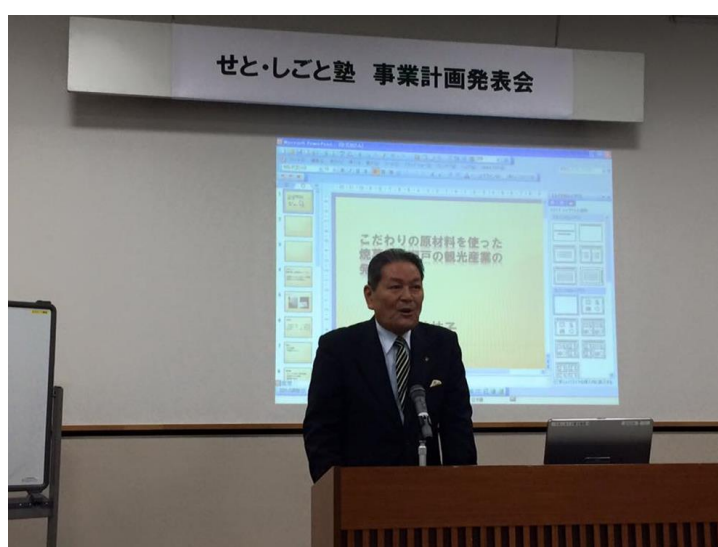
(2015. 11. 19 卒塾時事業計画発表会風景)