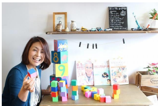
8期生の店舗をお借りしてのPR写真撮影会の一コマ