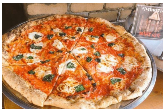
(Badfish Pizza 現在土岐の道の駅「まちゆい」に出店中)