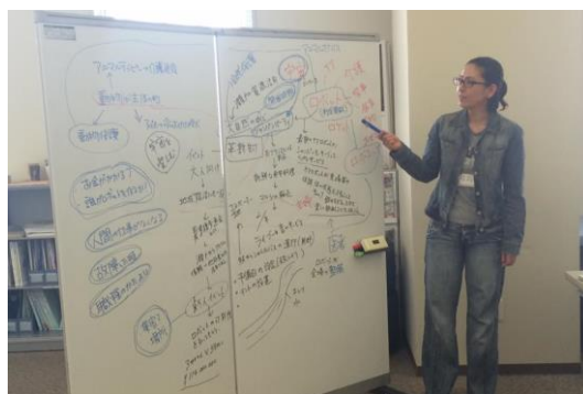
アイデア出しのワーク「セブンハット」の発表風景