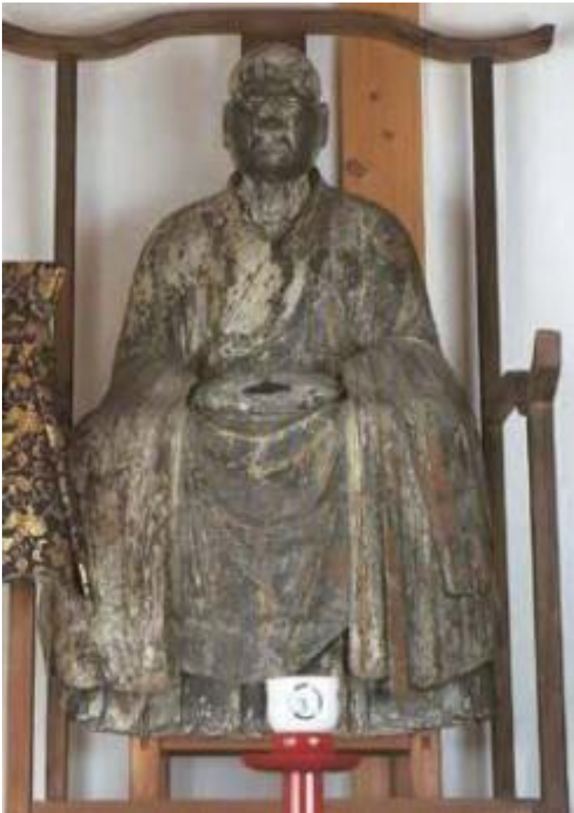
木造覚源禪師(平心処斉)坐像