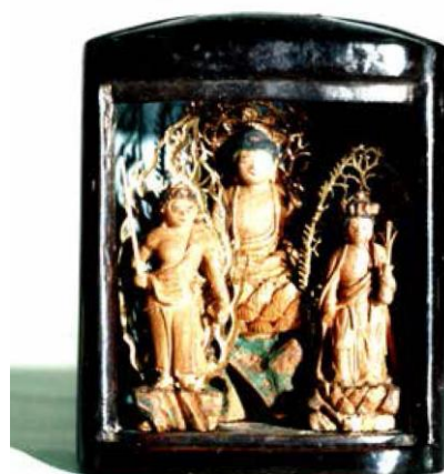
頭部納入檀像 「厨子入阿弥陀三尊像」