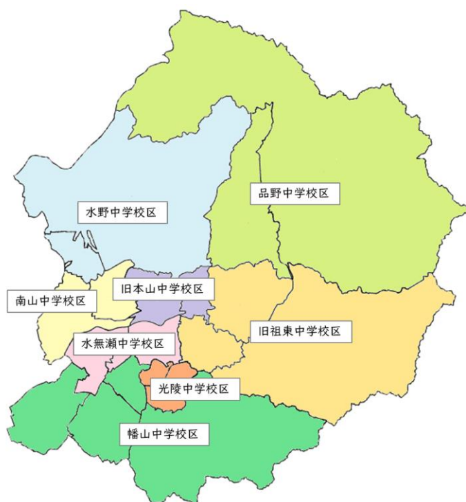
図 1-6 各中学校区の概要