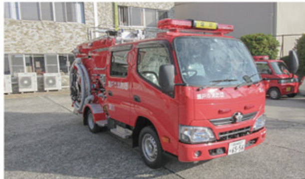
※写真はイメージであり、装備や表示等は異なります。

A 現行車両の運転には準中型の自動車免許が必要であったが、普通免許での運転が可能となる。さらに3.5トン未満と車両がコンパクトになり運用がしやすくなる。