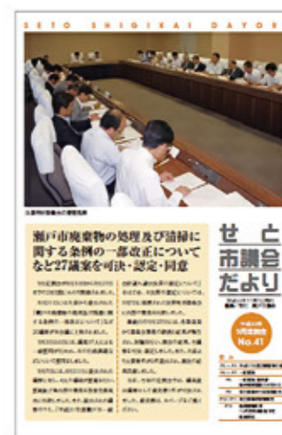
平成22年11月1日発行 議会だより表紙

これからもより一層市民の皆さんに親しまれる議会だよりとして編集担当一同が創意工夫を凝らしていきたいと考えておりますので、どうかよろしくお願いいたします。