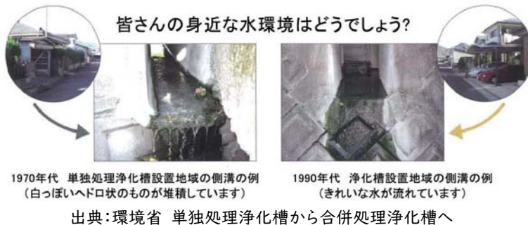
図 単独処理浄化槽と合併処理浄化槽の違い