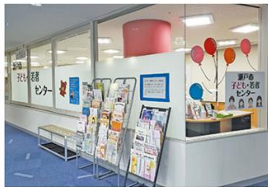
子ども・若者センター