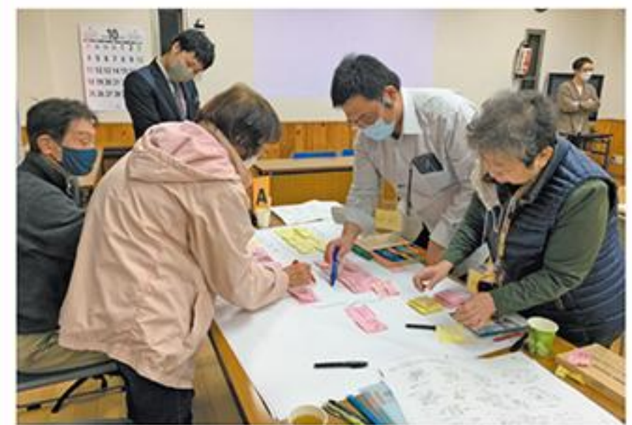
菱野団地再生ワークショップ