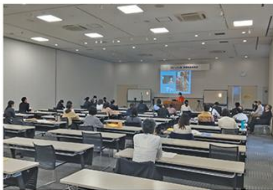
せと・しごと塾 事業概要発表会2021