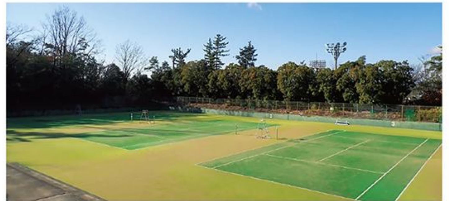
テニスコート照明LED化

陸上競技場については、市内でサッカーとラグビーができる唯一の陸上競技場のインフィールド内を天然芝から人工芝に切り替える。天然芝では、春・秋の約4ヶ月間の芝生の養生期間が必要であり、その間利用できなかったため、人工芝とすることで、天候に左右されず、年間をとおして利用できる事で過密日程を解消させる。なお、年度内の工事完了を予定している。