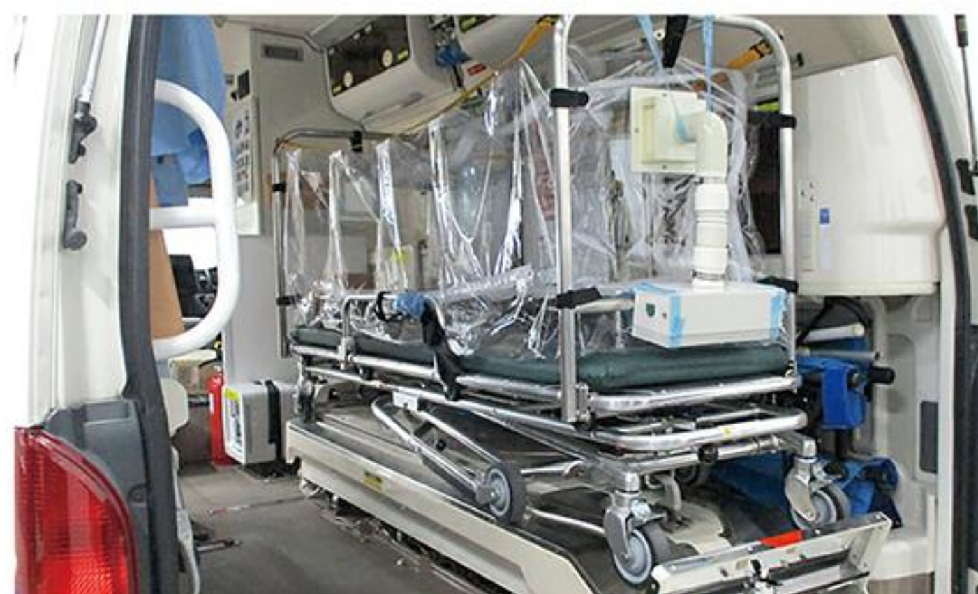
コロナ対策がされた救急車

A 通常は救急車の中に配備するが、電源が45分間連続使用可能なバッテリー式であるため救急現場からの使用も想定している。