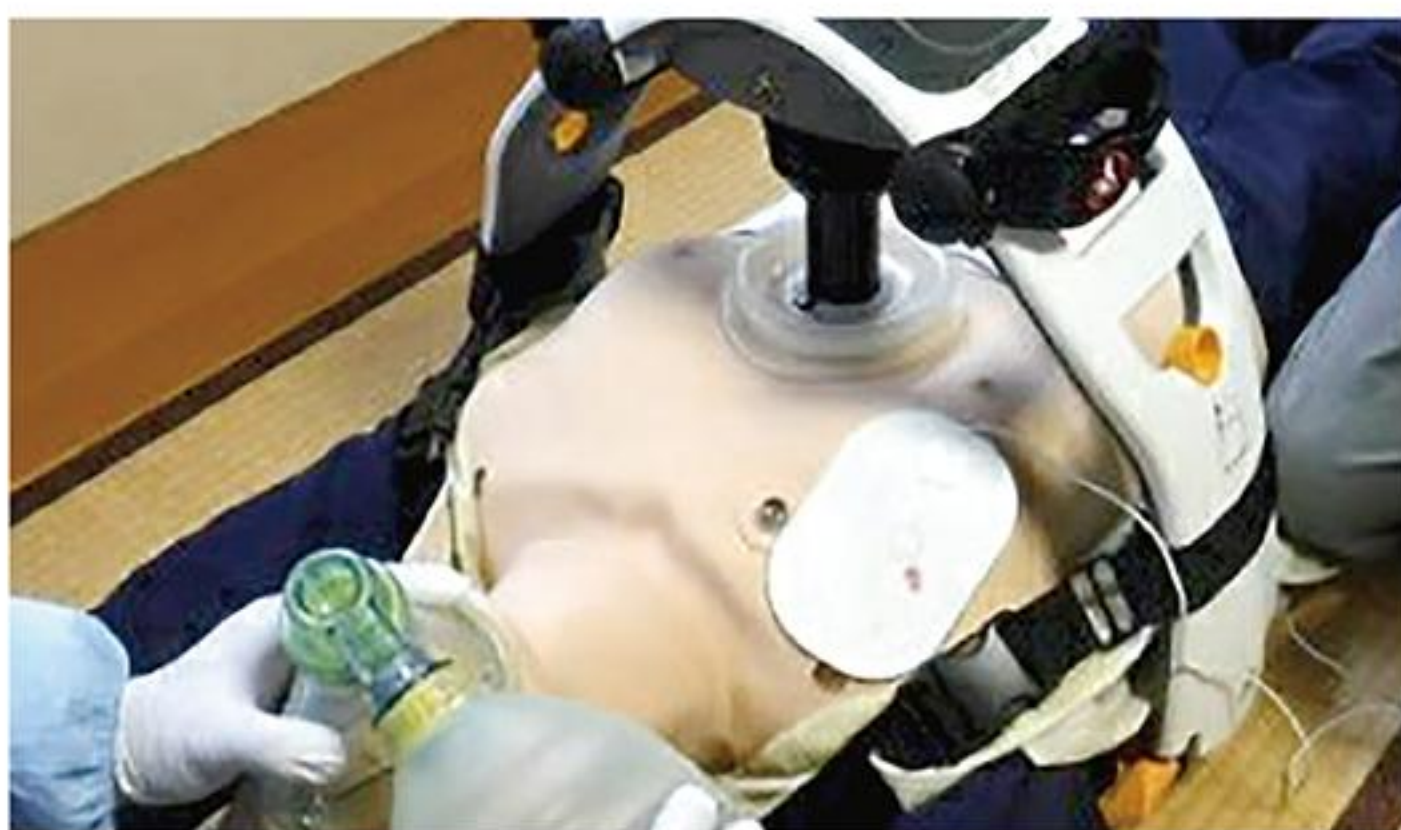
非接触心臓マッサージ器