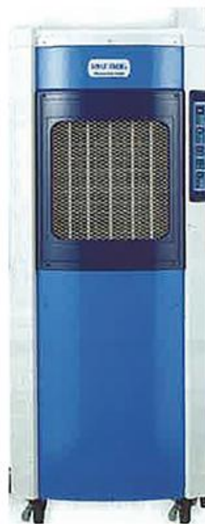
冷風器 (写真はイメージです)