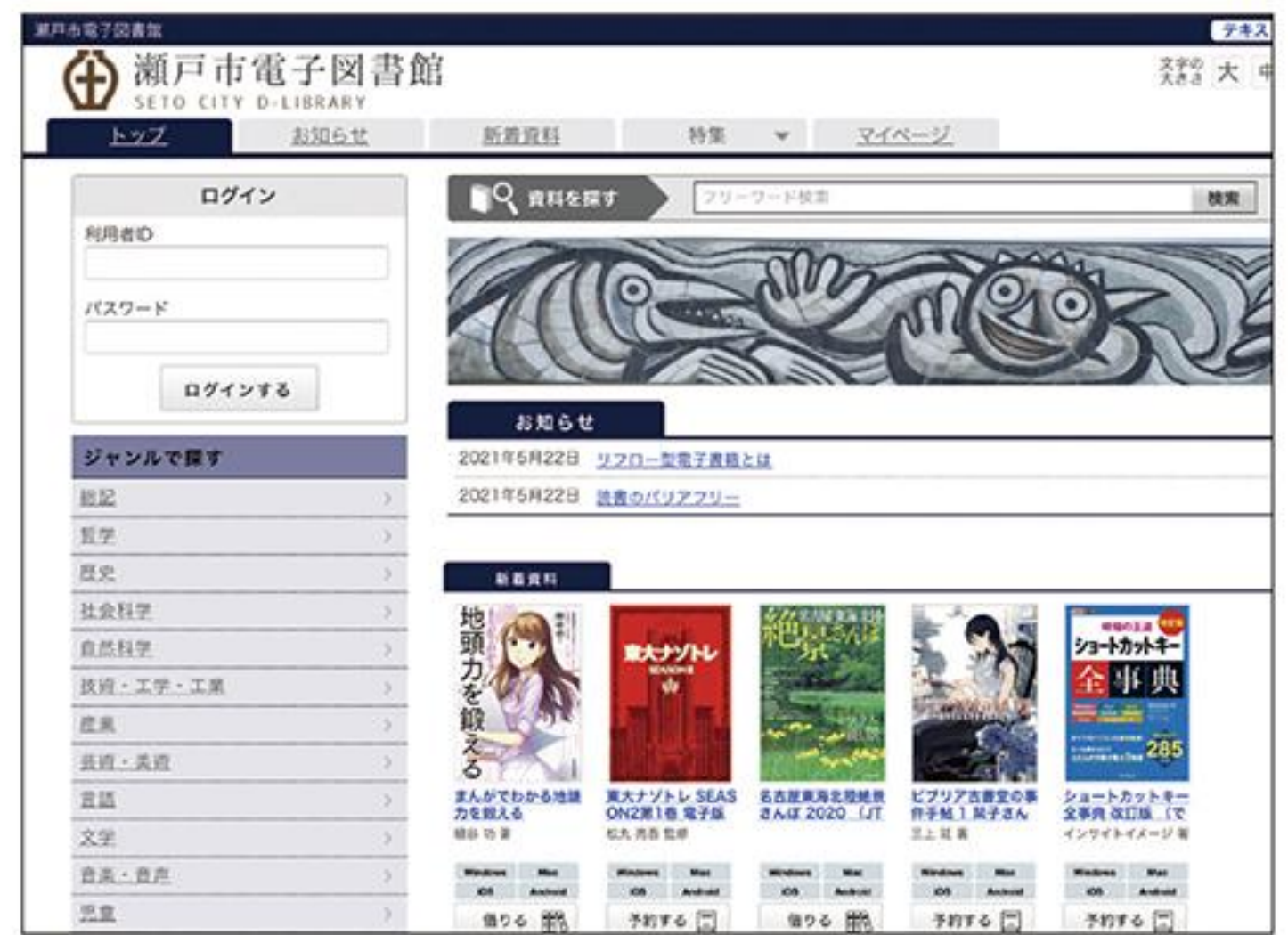
瀬戸市電子図書館トップページ

A インターネットの環境があれば、図書カードの番号とパスワードをパソコン等に入力すれば書籍を読むことができます。