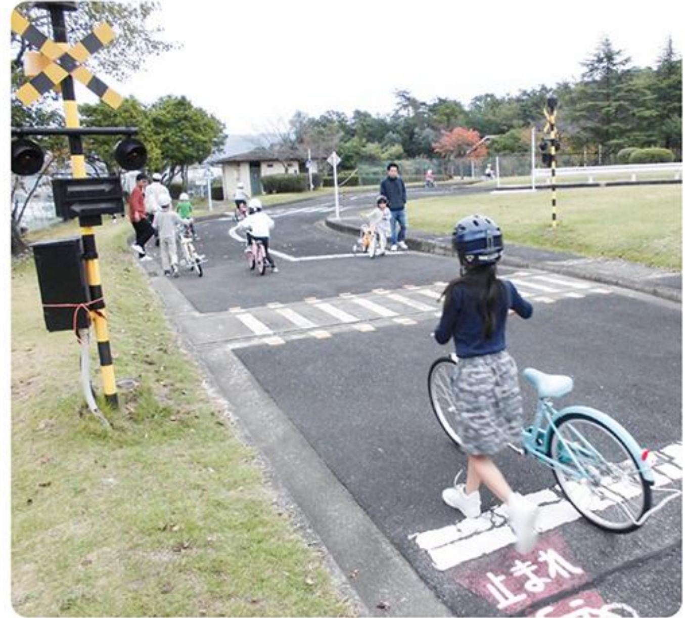
市民公園内せとクルランド(交通児童遊園)