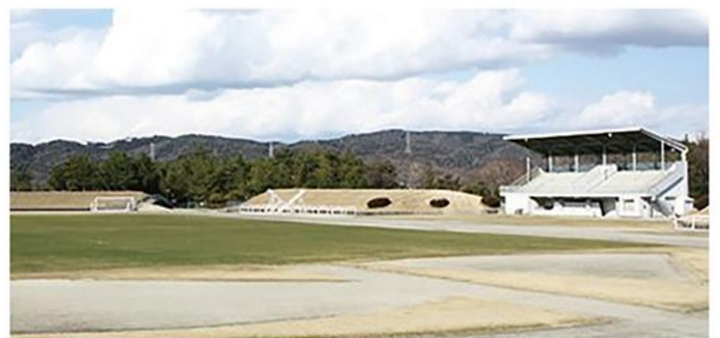
現在の陸上競技場

陸上競技場については、市内でサッカーとラグビーができる唯一の陸上競技場のインフィールド内を天然芝から人工芝に切り替える。天然芝では、春・秋の約4ヶ月間の芝生の養生期間が必要であり、その間利用できなかったため、人工芝とすることで、天候に左右されず、年間をとおして利用できる事で過密日程を解消させる。なお、年度内の工事完了を予定している。