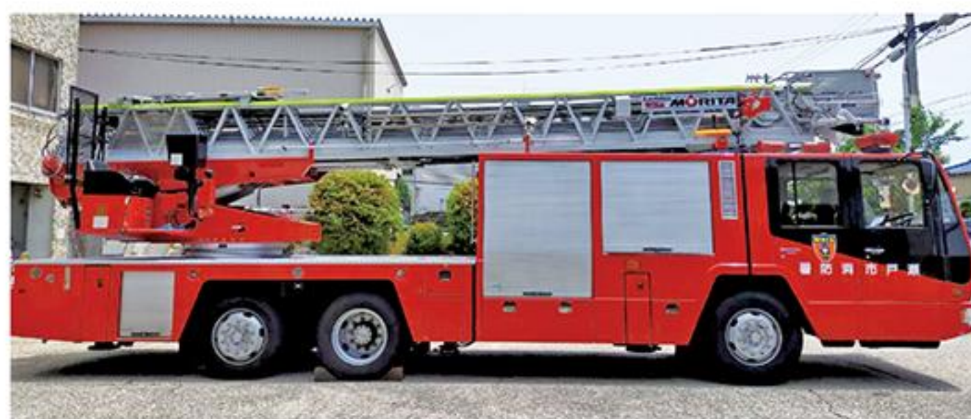
写真はイメージであり、機装や表示等は異なります

A はしご車が届かないおおむね11階以上の建物については建築基準法に基づく構造規制や消防用設備等の設備基準が厳しいので消防隊による消防活動により十分対応できると考える。