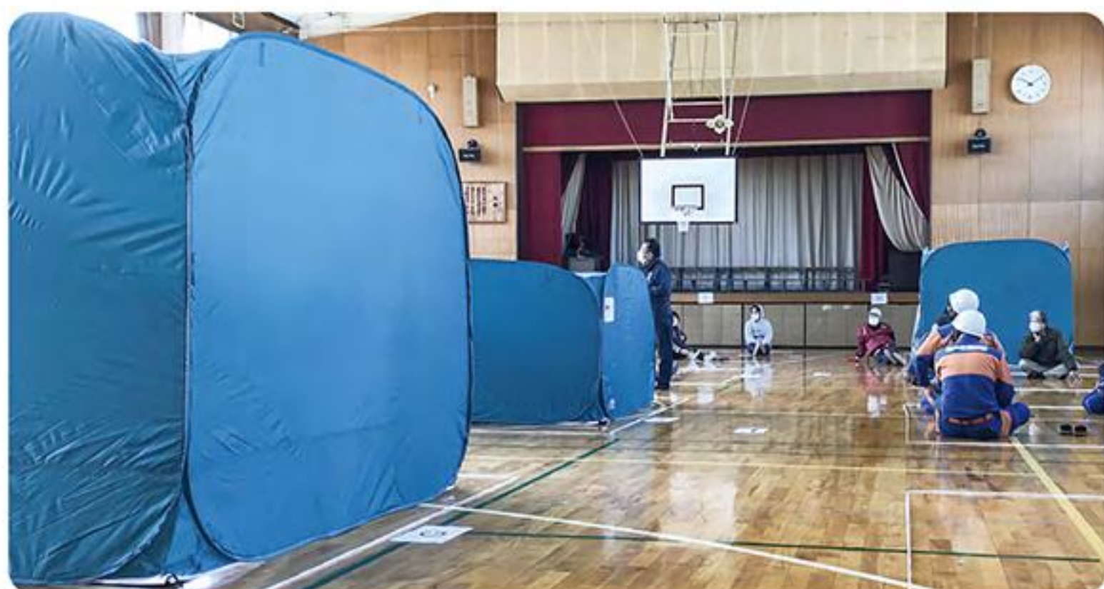
●避難所へのパーティション配備