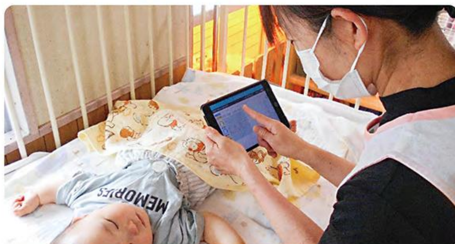
●保育園で使用する午睡センサーの導入