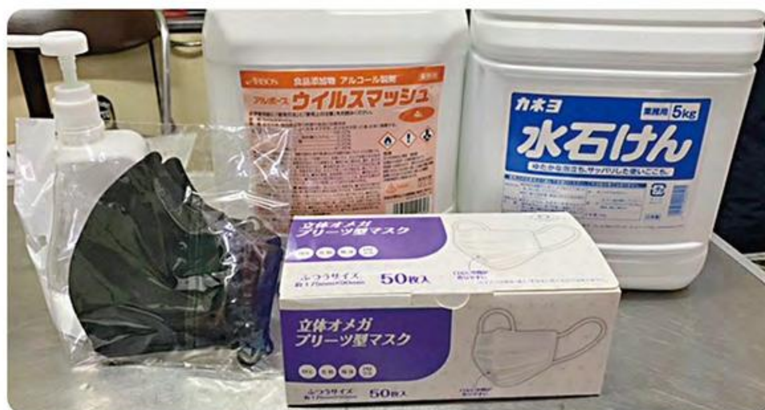
●消防団のコロナ感染対策