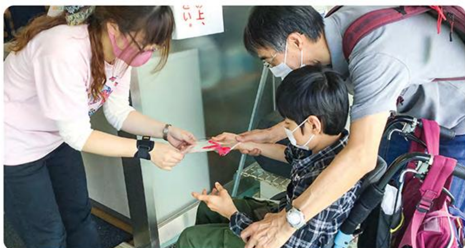
●地域とともにある学校づくり推進 瀬戸特別支援学校(花いっぱいプロジェクト)