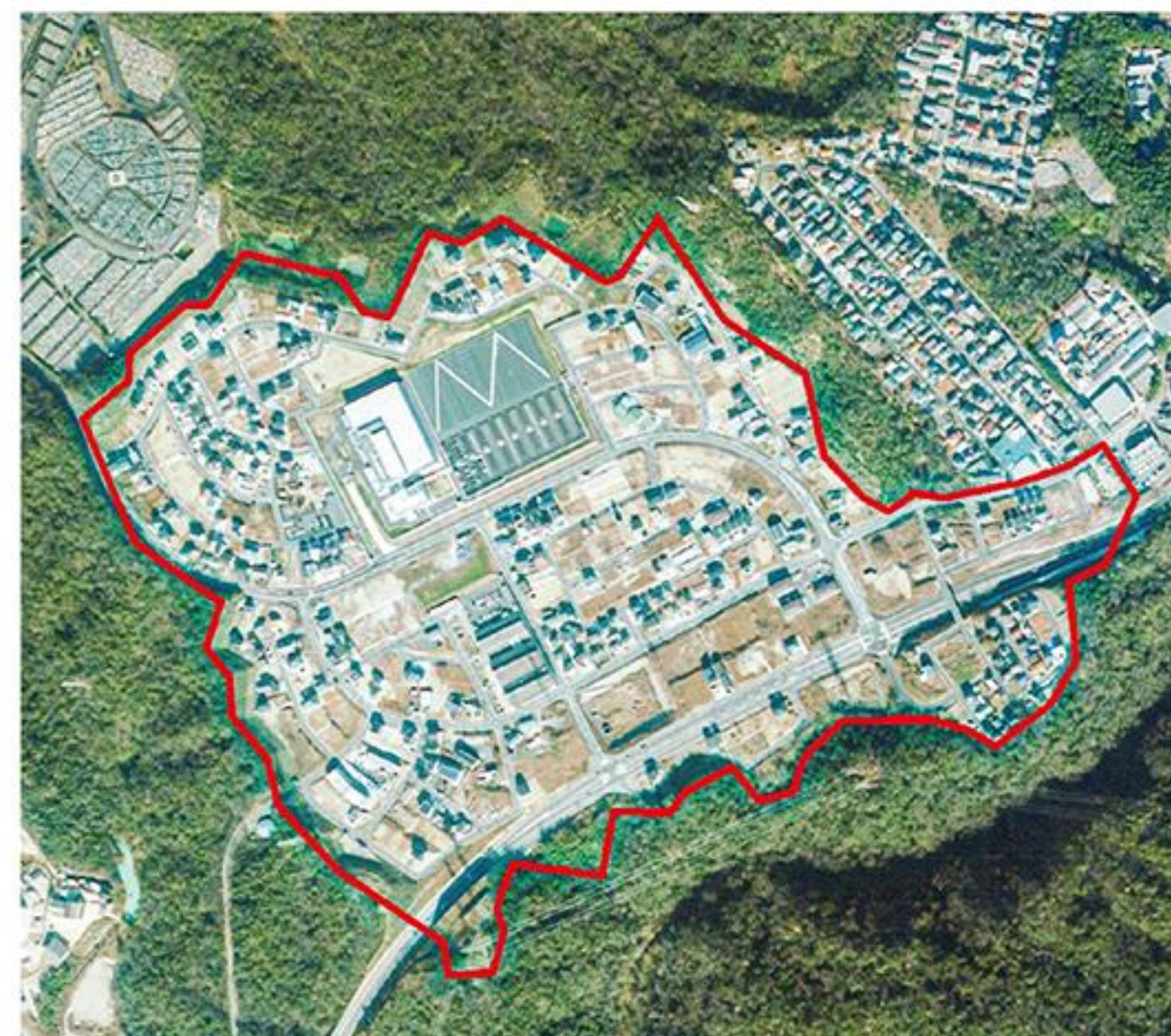
塩草町の一部を塩草が丘1丁目から4丁目までに設定