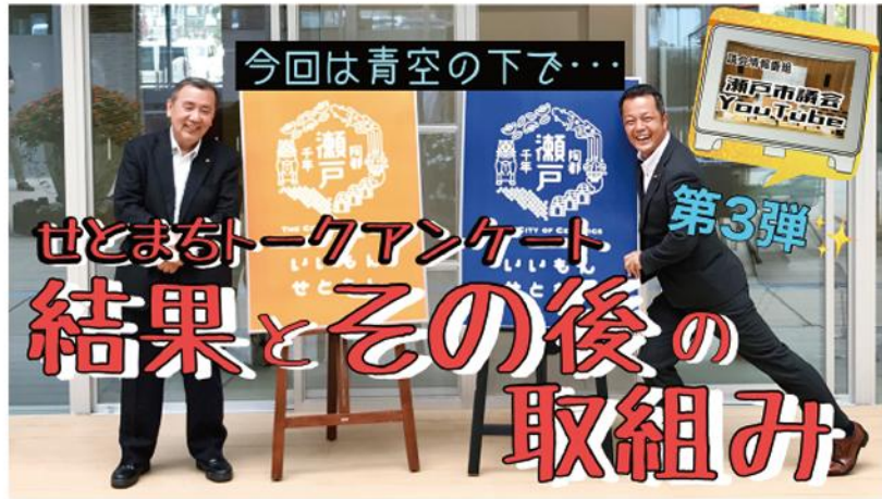
YouTube動画のサムネイル

5月に行った「せとまちトークアンケート」について、市民の皆さまの意見を分類し、政策検討会議(全議員による話し合いの場)で今取り組むべき課題を検討しました。そして、各課題を担当の委員会に振り分け、調査研究を進めています。