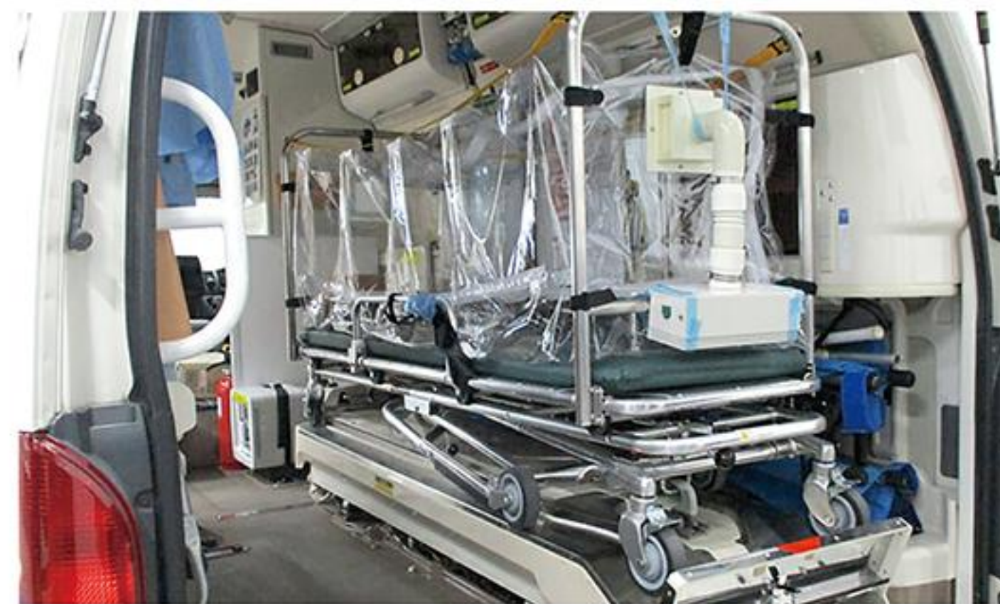
コロナ対策がされた救急車

A 通常は救急車の中に配備するが、電源が45分間連続使用可能なバッテリー式であるため救急現場からの使用も想定している。