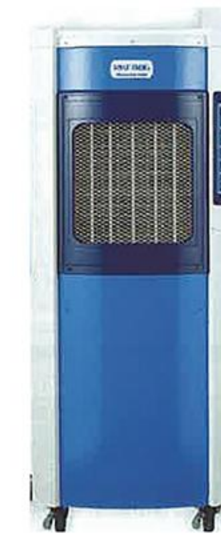
冷風器 (写真はイメージです)

A 体育館全体を冷やすことは困難であるが、子どもたちのコロナ感染予防と熱中症予防を目的としている。適宜、休憩をとり冷風機の前で体を冷やしたり換気ができるよう利用を促していく。