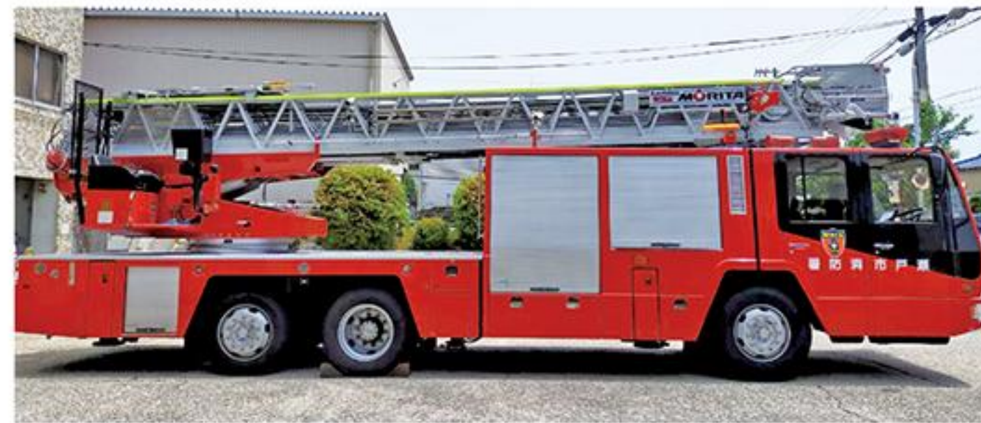
写真はイメージであり、艗装や表示等は異なります

A はしご車が届かないおおむね11階以上の建物については建築基準法に基づく構造規制や消防用設備等の設備基準が厳しいので消防隊による消防活動により十分対応できると考える。