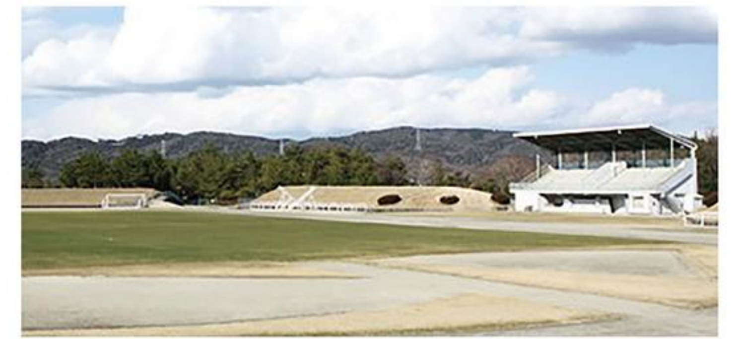
現在の陸上競技場

陸上競技場については、市内でサッカーとラグビーができる唯一の陸上競技場のインフィールド内を天然芝から人工芝に切り替える。天然芝では、春・秋の約4ヶ月間の芝生の養生期間が必要であり、その間利用できなかったため、人工芝とすることで、天候に左右されず、年間をとおして利用できる事で過密日程を解消させる。なお、年度内の工事完了を予定している。