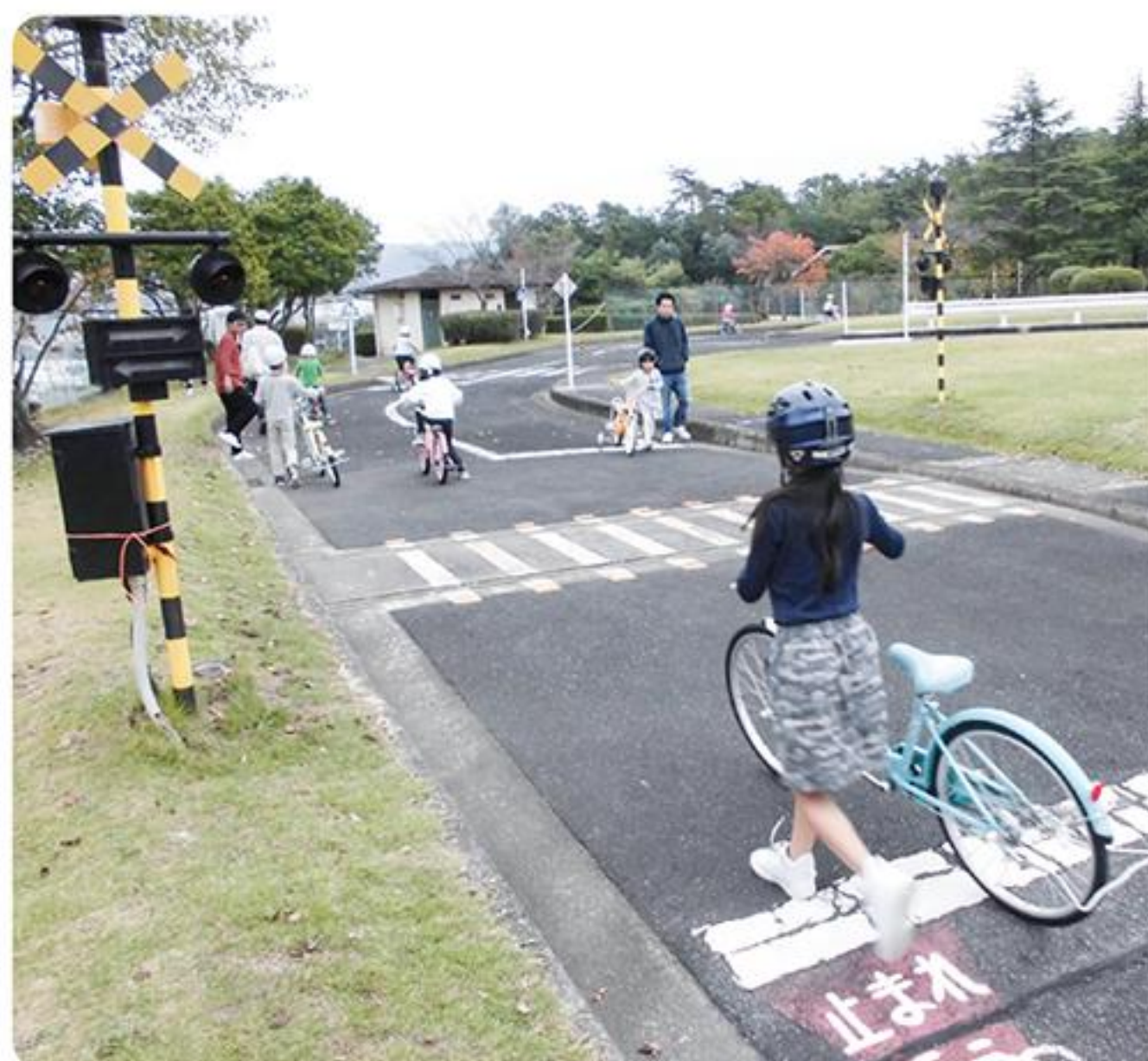
市民公園内せとクルランド(交通児童遊園)