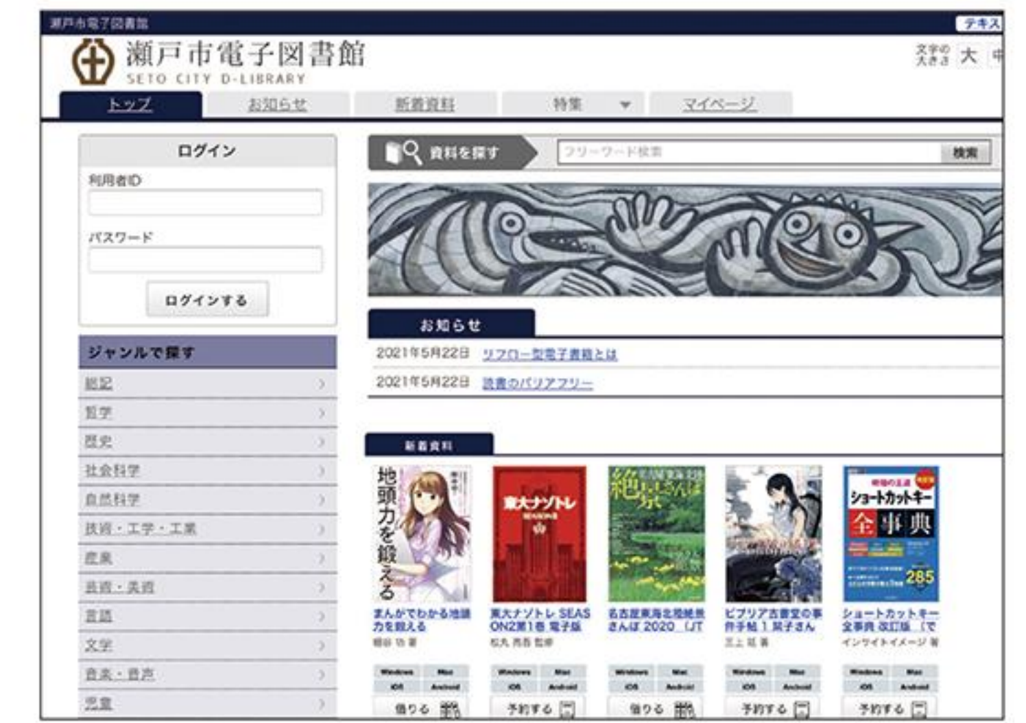
瀬戸市電子図書館トップページ

A インターネットの環境があれば、図書カードの番号とパスワードをパソコン等に入力すれば書籍を読むことができます。