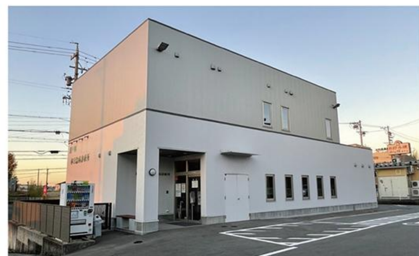
瀬戸市立休日急病診療所(西長根町)

A 発熱外来では新型コロナが疑われる方には、令和2年11月から抗原検査を行っている。