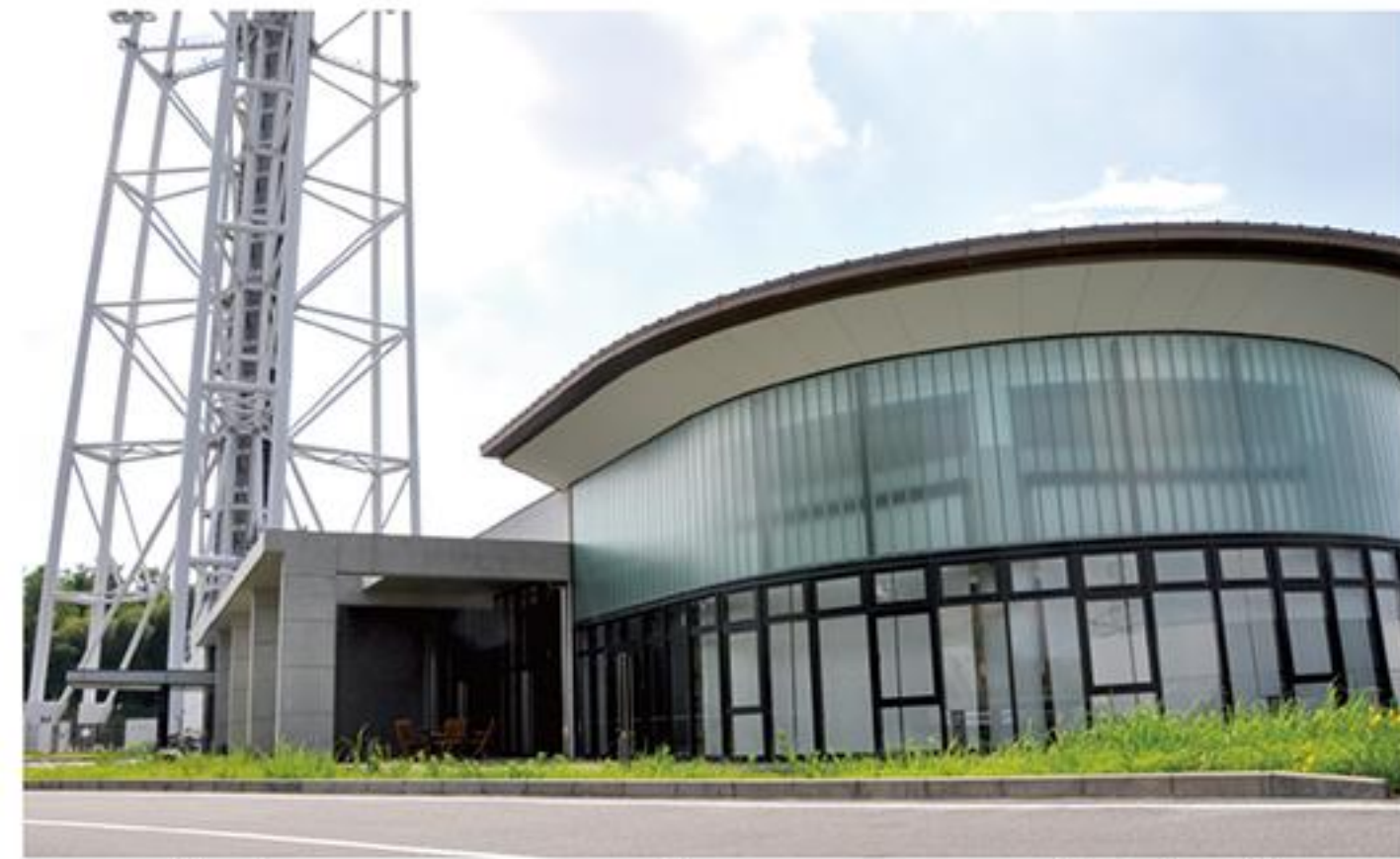
デジタルリサーチパークセンター(幡中町)

各常任委員会で各議案について審査を行いました。そのうち主な議案について審査内容をお知らせします。