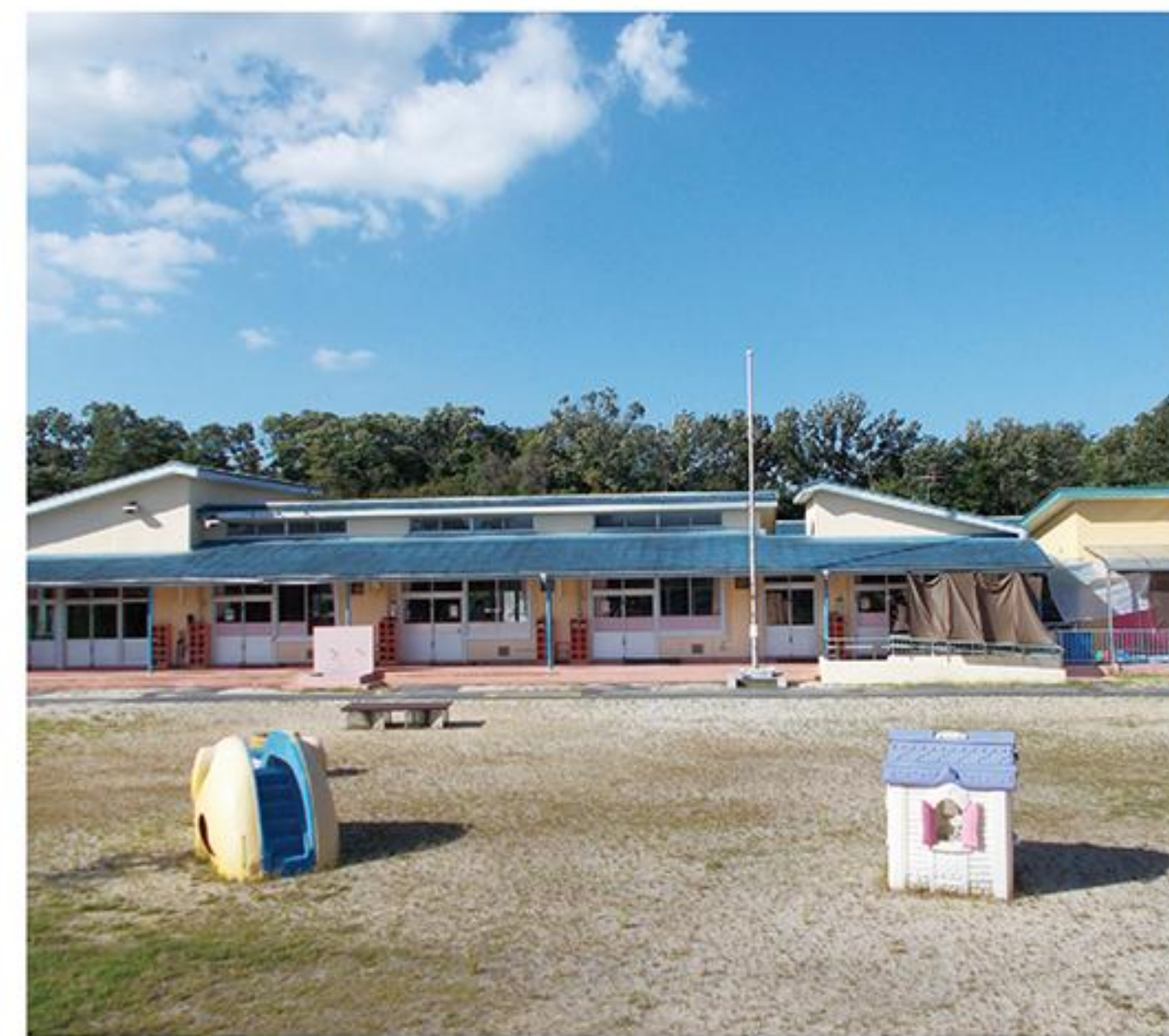
児童発達支援センターのぞみ学園(原山町)

A のぞみ学園は学園療育を中心とした児童発達支援を、発達支援室は相談支援・家族支援・地域支援の3事業に整理し、利用者や市民の皆さんにとって分かりやすくする。また、スタッフの一元化や計画的な資格取得が可能になるなどの利点もある。