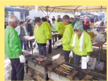
菱野団地商店街のおいしいさんま祭りも大盛況