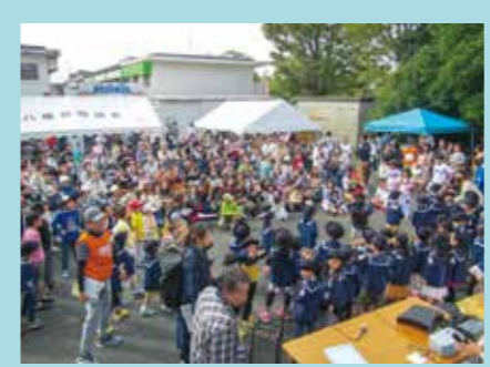
たくさんのステージイベントでは子どもから大人までみんなで盛り上がりました