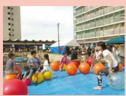
体験スペースではみんなでバランスボールなども楽しみました