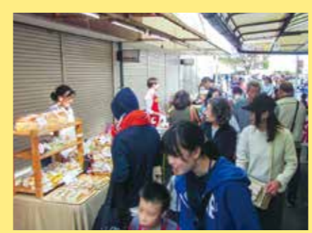
商店街はたくさんの人通りで活気があふれました