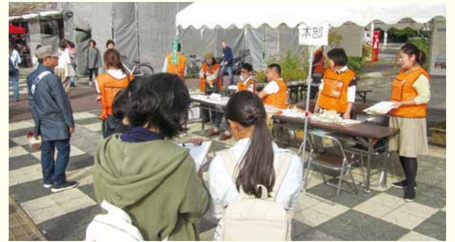
みんなの会 本部ブースの様子