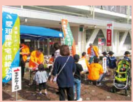
愛知県住宅供給公社のモデルルーム公開やミニゲームによる住まいのPR