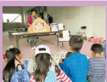
キッズスペースでは紙芝居や大型絵本など子どもたちも楽しみました