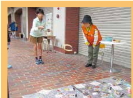
ウイングビル レンガ通りでは輪投げやボードゲームなどで楽しみました