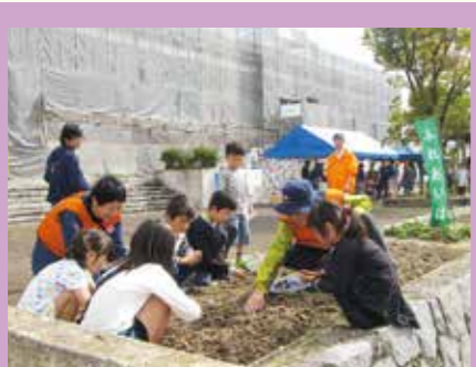
子どもたちはたねだんごをつかって中央広場の花壇(ふれあいば)へ植えました