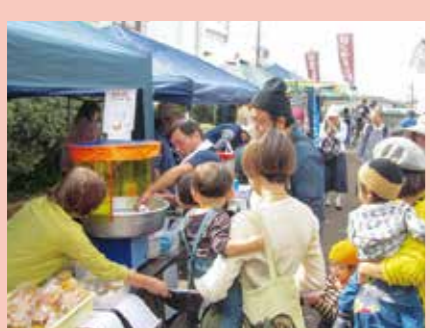
マルシェではおいしいものやお気に入りの一品がたくさん

今年のわいわいフェスティバルは、菱野団地中央広場、北広場、菱野団地商店街、ウイングビルなどのセンター地区を会場に、マルシェやステージ、スタンプラリーなどを開催しました。また、菱野団地商店街のさんま祭り、萩山台商店街のハンドメイドマルシェとも同日開催し、当日は約2,000人の方にご来場いただき、センター地区がとても賑わいのある空間になりました。