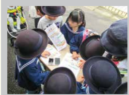
会場内に10箇所ちりばめられたスタンプをさがしてめぐるスタンプラリー