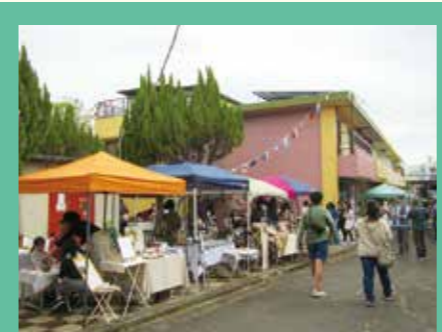
ハンドメイドマルシェでにぎわう萩山台商店街