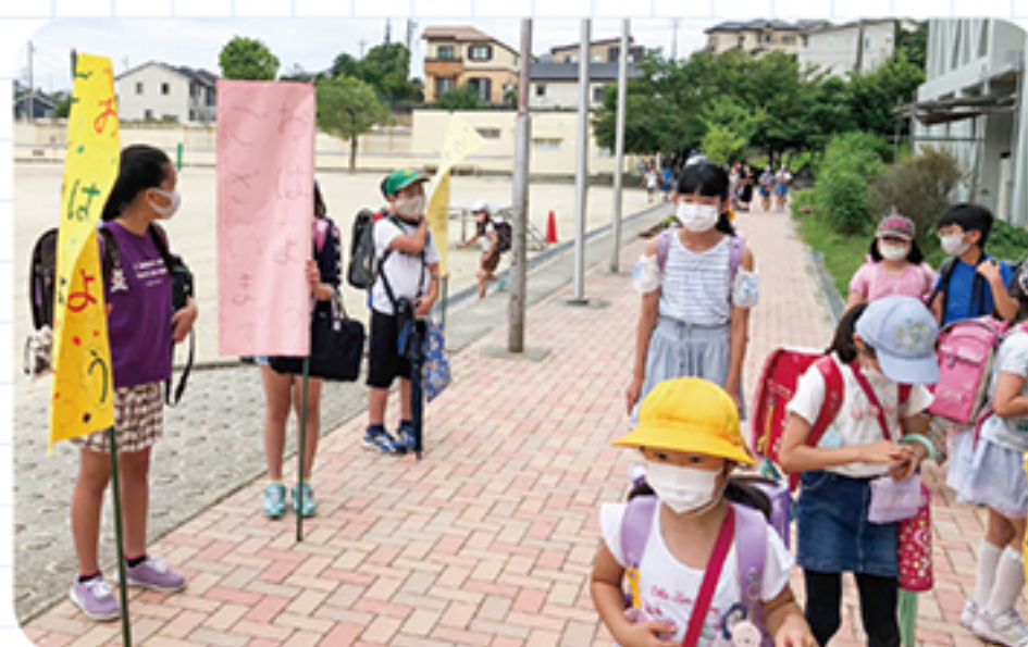
あいさつ運動の様子(東山小)

各学校での募金に加え、地域のご協力のもと、水野駅、瀬戸市駅での募金活動も行い、集まった義援金総額280,629円は日本赤十字社を通じ、被災地へ送付しました。ご協力ありがとうございました。