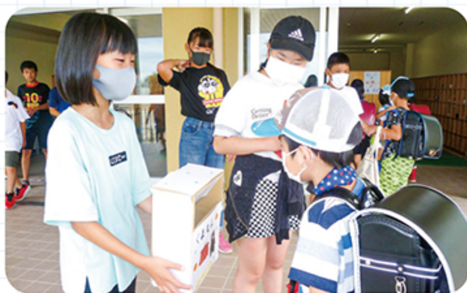
募金の様子(左から南山中、效範小、水南小)