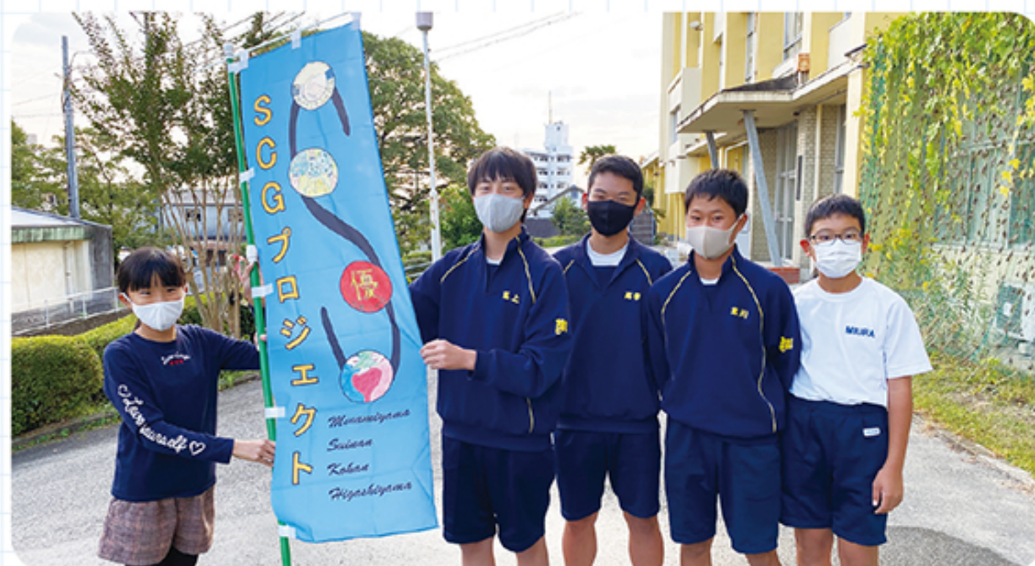
完成したのぼり旗