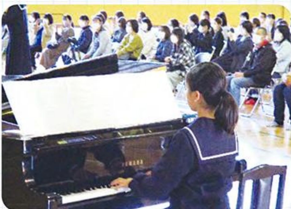
品野中での学年発表会の様子

動画を鑑賞した小学生からは、「うたがきれいなこえでした。」「ぜひ生でききたかった。」「中学校にいったら、こんなことをするんだなとおもった。」などの感想がありました。