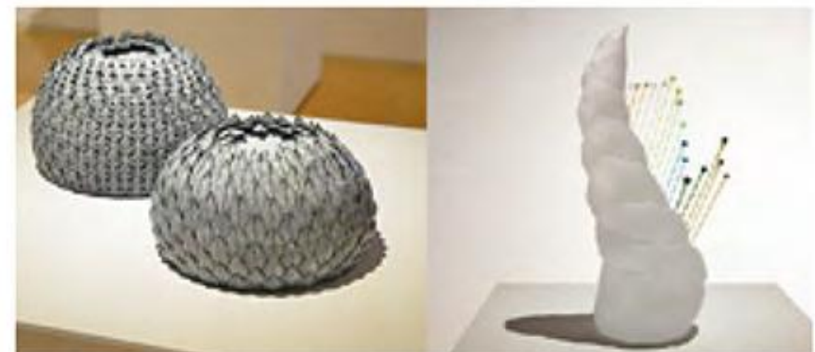
田中純「冬を纏う」 佐々木伸「ねじれ」 ※昨年度展示作品