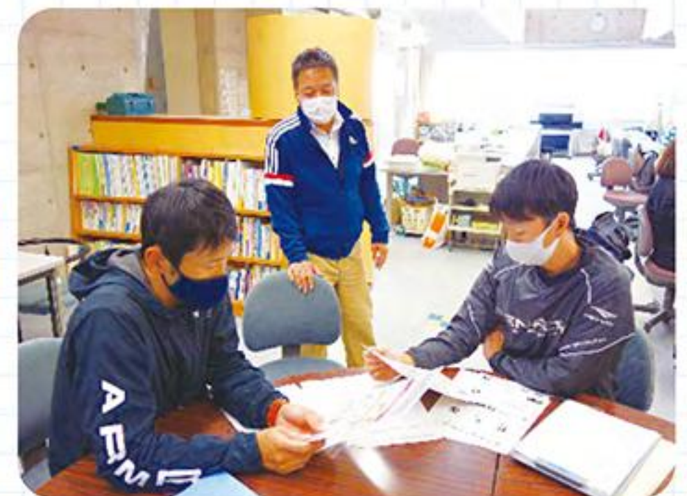
打ち合わせをする教員