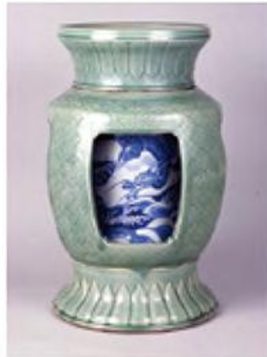
青磁陽刻染付龍濤文大花瓶 伝加藤民吉 19世紀前期