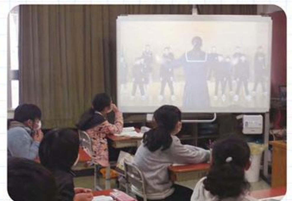
掛川小での動画観賞