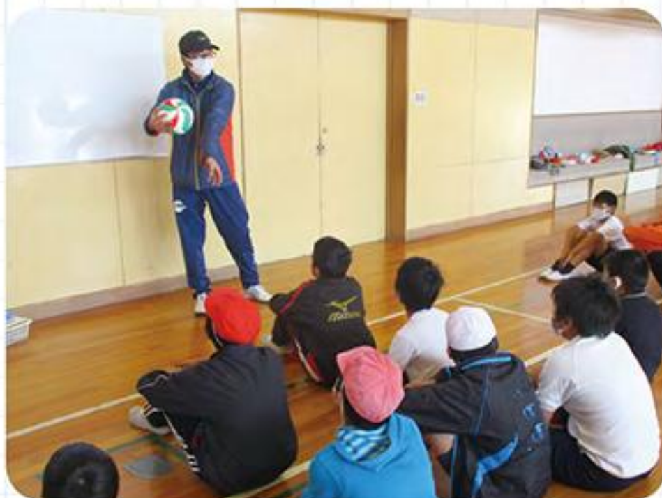
下品野小での授業

品野中学校の体育の教員が、毎週火曜日に下品野小学校を、水曜日に品野台小学校を訪れて高学年の体育の授業に参加し、小学校の教員とともに「小中チーム・ティーチング」を行っています。これは、「体育好きな児童を増やし、健やかな体を育む」ことをねらいとしています。また、数年後には中学校に入学する児童たちが、中学校の教員と触れ合うことで安心感をもってもらいたいという願いもあります。