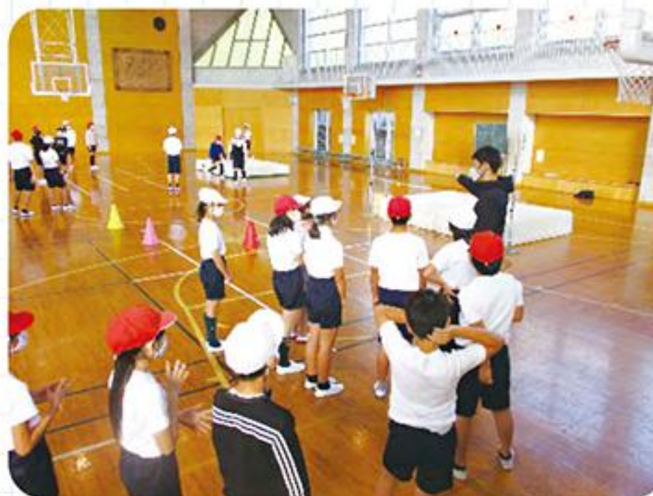
品野台小での授業