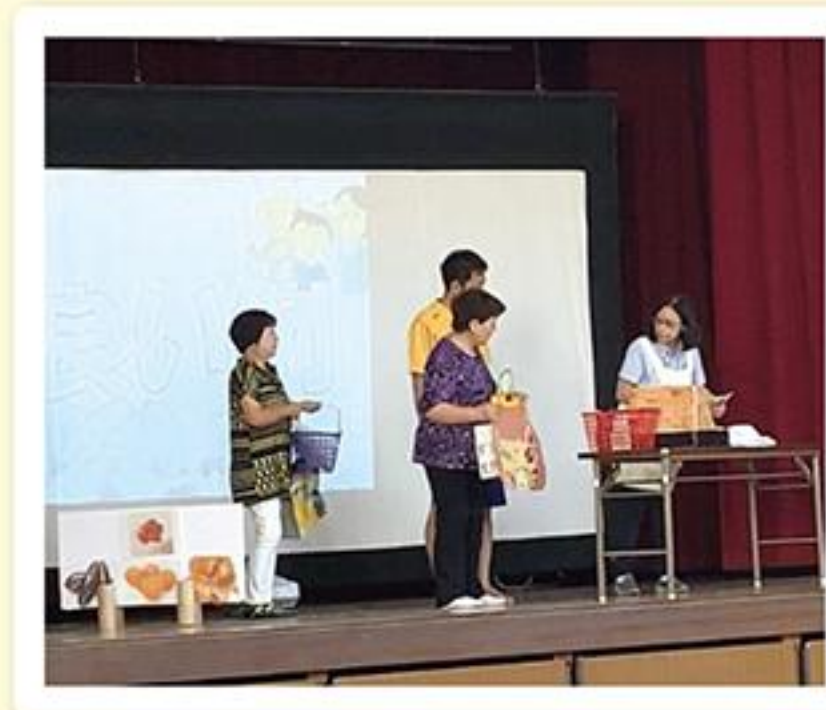
「劇団みずの座」による寸劇

認知症サポーター養成講座については、各地域包括支援センターで受講いただけます。くわしくは、折込チラシ「せとらカフェMAP」の裏面「各地域包括支援センター」までお問い合わせください。