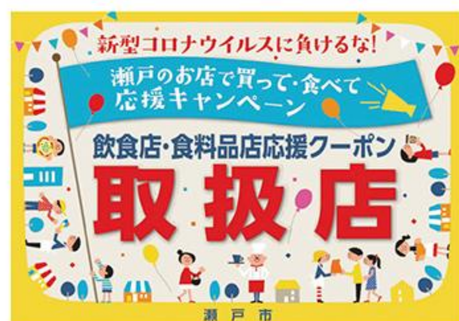
登録店舗ステッカー