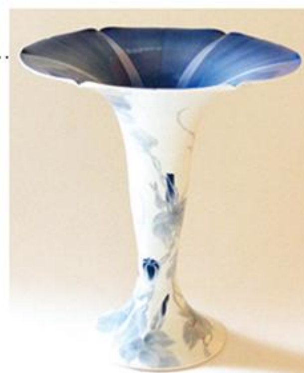
染付瓶「朝顔」 2020年制作