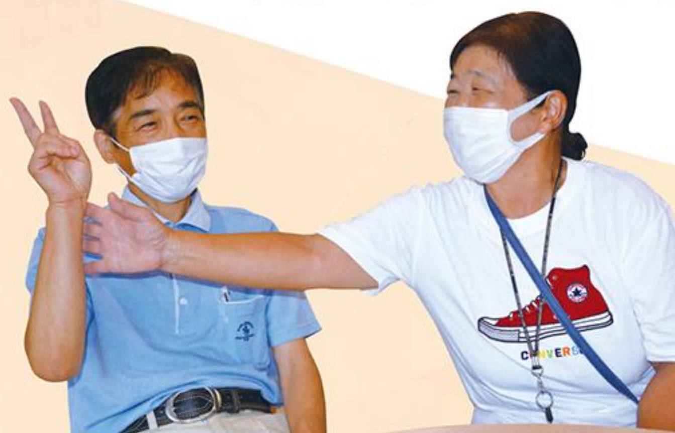
インタビュー中の様子

今の主人を守ってあげられるのは自分だけです。今まで主人が守ってくれたように、恩返しのつもりで、今度は私が主人を守っていきたい。これからも、きっと大変なことはたくさんあるとは思いますが、周りの方にも助けてもらいながら、主人と一緒に暮らしていきたいと思っています。