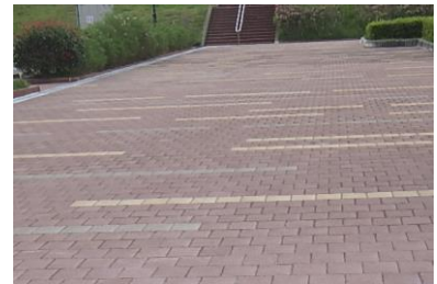
【マルチシェルター】