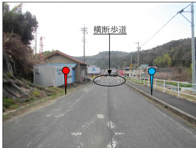
（上半田川町集荷所）

※上り下りとも、横断歩道からの離隔を十分にとり、歩行者、乗降客及び通過交通の安全を確保する。