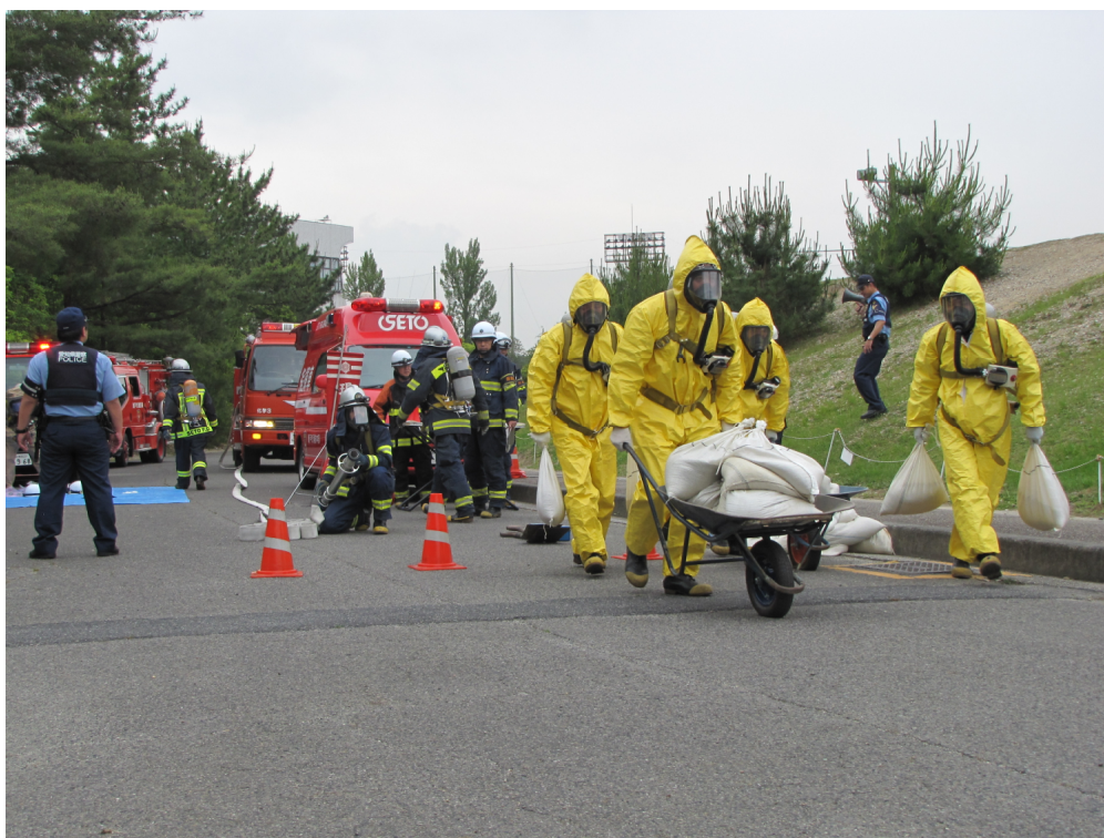
危険物災害対応訓練