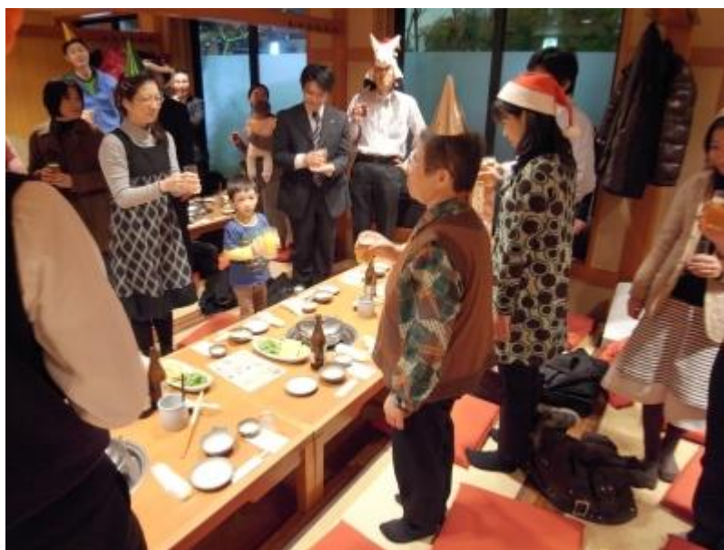
(第3期卒塾式後の懇親会の様子)

第3期は、塾生による講座が3回（ビジネスマナー講座、起業体験談、国際協力セミナー）と、酒造り体験ツアーのイベントが第2期に引き続き行われるなど、参加した塾生による手作りの催しが見られました。また、塾生の事業をどのようにして盛り上げていくかをディスカッションする会も卒塾生を中心に立ち上がり、お互いを支え合う雰囲気がさらに広がりを見せています。