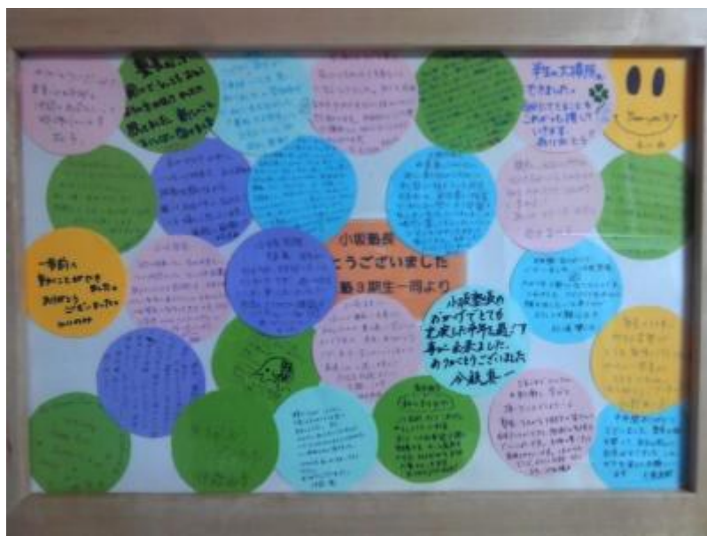
(第3期も卒塾時に寄せ書きをいただきました！)

以上、95 項目を紹介しました。人によって、どこに困難を感じるかは異なります。小さなことから挑戦し、成功体験を重ねていくことで自信をつけ、さらに行動を加速させていくように意識をしていました。上記の結果を見ると、半年間がとても充実した時間になっていたことがよく分かります。