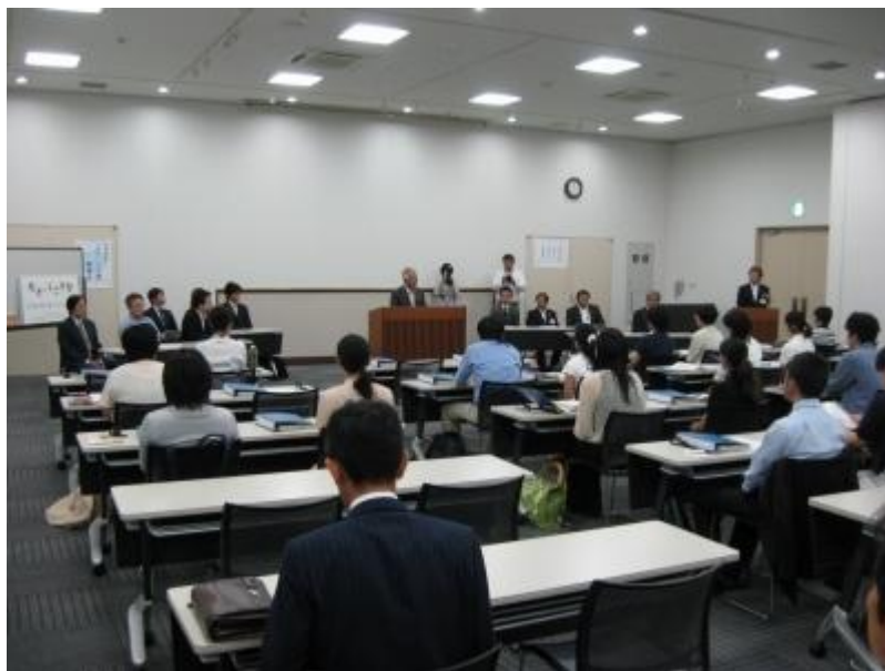
(H22.7.1 第3期開講式の様子)