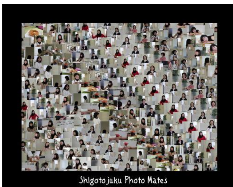
(プロフィール写真の数々)

卒塾生からホームページ、会社案内、チラシなどに自分の顔写真や商品写真を掲載するけれども、よい写真がなかなか撮れないという声が寄せられていました。そこで、3期生により、プロフィール写真撮影会が企画されました。卒塾後の1月に実施。これらの写真は、早速塾生のチラシや開業案内に掲載されています。撮影当日は、賑やかな雰囲気の中で、7名・約1000枚の写真を撮影しました。