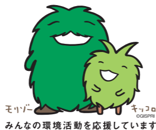
モリゾー キッコロ みんなの環境活動を応援しています