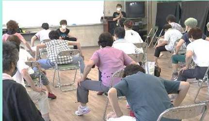
健康ストレッチ体操