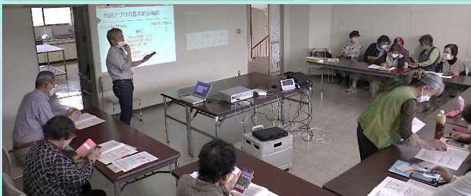
スマートフォンの学習風景