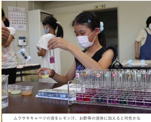
ムラサキキャベツの液をレモン汁、お酢等の液体に加えると何色かな