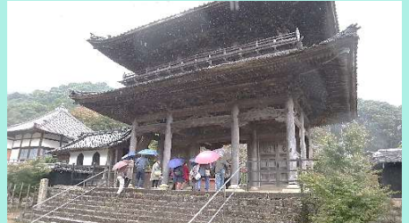
行基寺拝観、別名(お月見の寺)