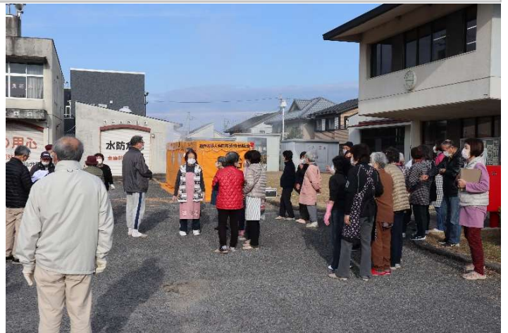
避難訓練(全員の無事確認)