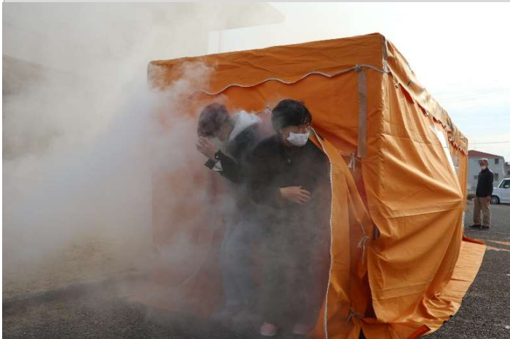
煙体験(煙で充満している長さ5mのテントの中を通り抜ける)

幡山公民館の2階調理実習室から9:15分頃出火したと想定し、避難訓練、煙体験を実施。 その後、公民館の大掃除を行いました。