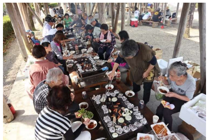
バーベキュー風景