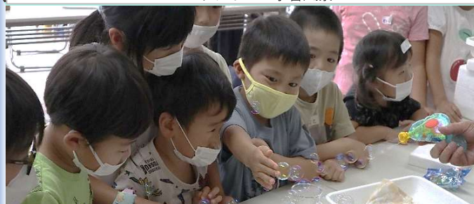
しゃぼん玉を液体窒素に触れてみると