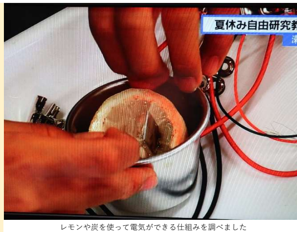
レモンや炭を使って電気ができる仕組みを調べました