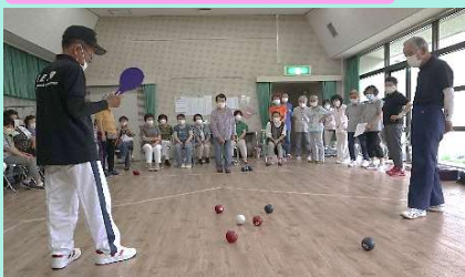
ポッチャのゲーム体験