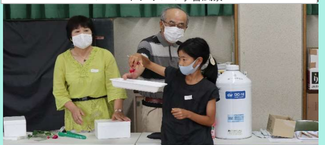
バラの花びらを液体窒素に触れてみると