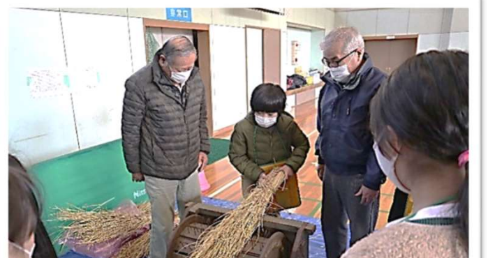
脱穀機の作業に挑戦