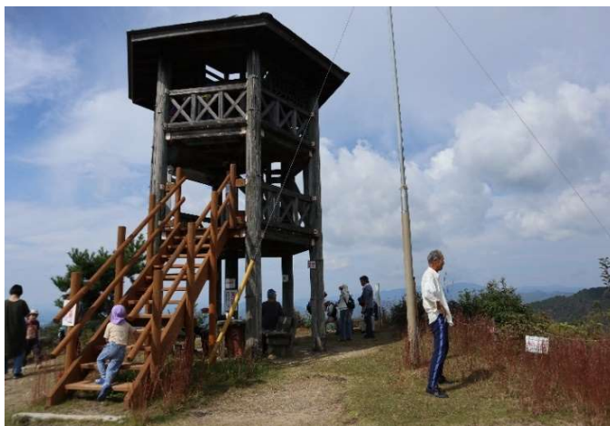
山頂にあるよろこびの砦