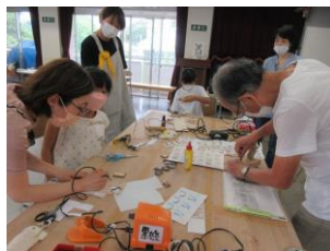
キャラクターストラップを作ろう