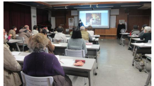
印象派の画家たちと作品、そしてジャポニズムの関係→