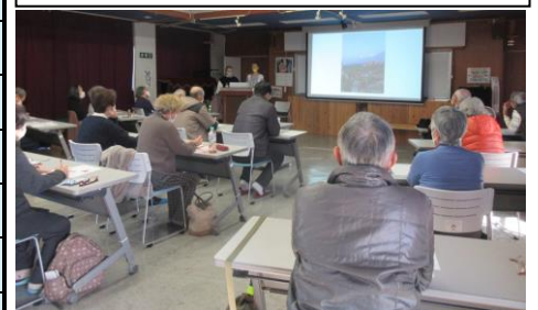
講義:ウクライナを知ろう 「ウクライナの文化と歴史、そして今」