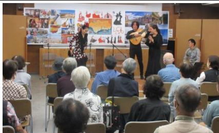
フラメンコライブコンサート