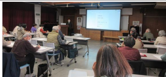
実は身近な仏教用語の世界