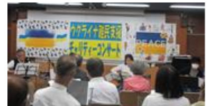
ウクライナ難民支援コンサート