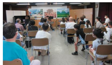
夏休み親子向けコンサート