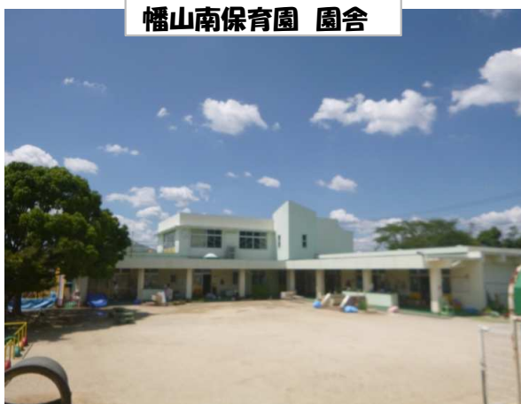
幡山南保育園 園舎

※コロナの状況により中止となる場合もあります。詳しくは電話でお問い合わせ下さい。