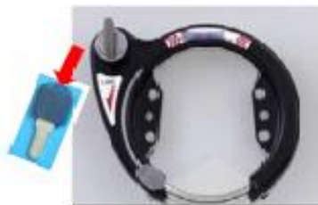
シリンダー式馬蹄錠